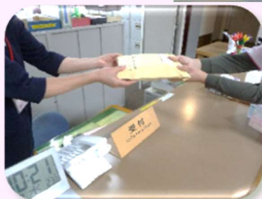
フロントサービス