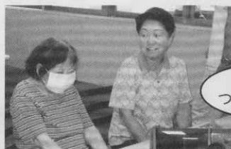
子ども達から沢山元気もらいました