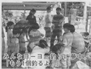
みんなヨーヨー釣りに夢中。「もう1個釣るよ！」

また十年ぶりに町会で行われた鮫洲八幡神社例大祭の折には、親子参加でのお母様が、高齢者住宅の方に付き添い、神輿担ぎの往路を見守ってくださいました。