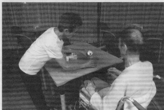
『居酒屋さくら』 「一杯どうぞ」