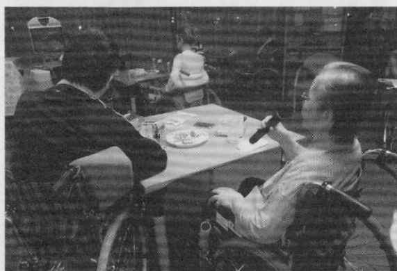
『居酒屋さくら』 カラオケ中

〒140-0013 品川区南大井5-19-1 ☎(03)5753-3900(代)・FAX(03)5753-3955 ホームページ: http://www.sakurakai.jp/