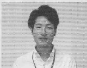
撮影にて町林井大の顔