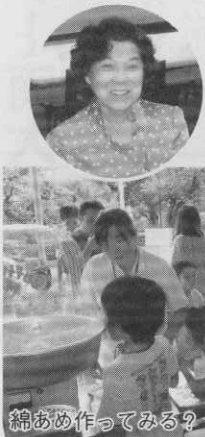
綿あめ作ってみる？

満月の夜、町会の方が、「大井林町の皆さん達が来てくださったから、町会も、明るく楽しく、まあるくなりますよ…。」と語ってくださいました姿が、胸に残っています。