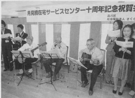
ボランティアの方々によるステージ