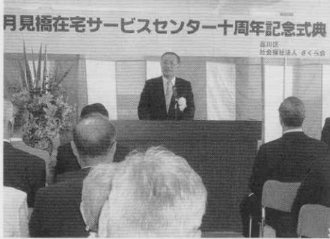
月見橋在宅サービスセンター十周年記念式典