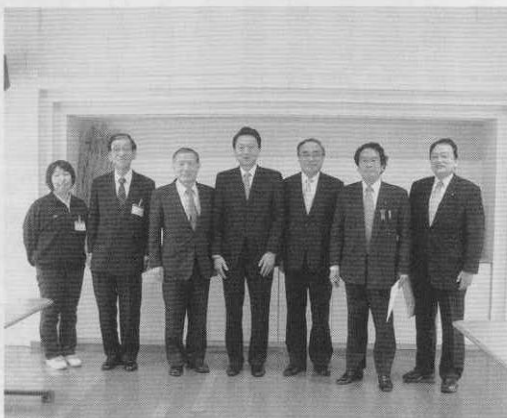
総理御一行と濱野区長、前田理事長等を囲んで

次に4階の洋風庭園・和風庭園をご覧になられ、続いて2階のリハビリのスケジュールやフリードリンクコーナー、1階のリハビリの様子を視察されました。ご利用者から直接お話を聞かれ、また、在宅復帰率や介護の様子についても熱心にご質問されました。 お帰りの際は、お見送りの職員にも労いの声をかけていただき、その人柄がうかがえるご訪問でした。