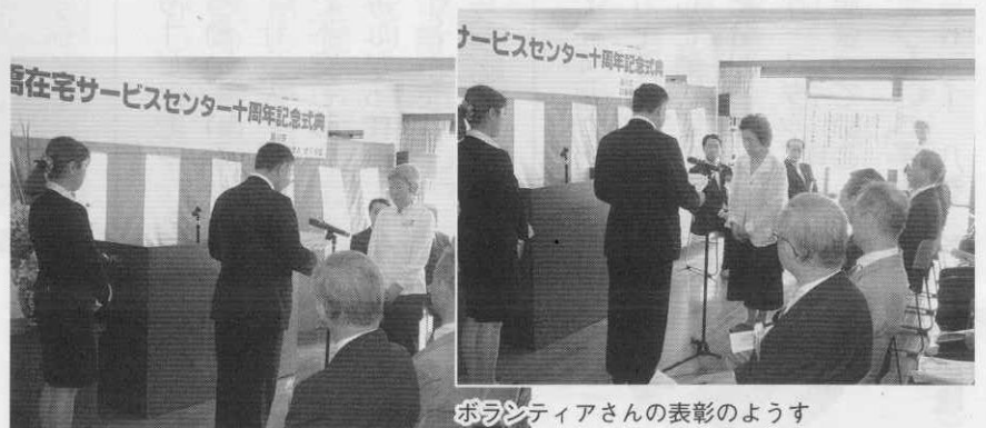
ボランティアさんの表彰のようす

次に上原所長より月見橋十年の歩みを披露し、開設当初より活動していただいているお二人のボランティアさんの表彰と続きました。月見橋の歴史を振り返り、これまでのご支援ご協力に感謝する式典となりました。これからも地域の皆様のお役に立てるよう努力してまいります。引き続きご厚情賜りますようお願い致します。