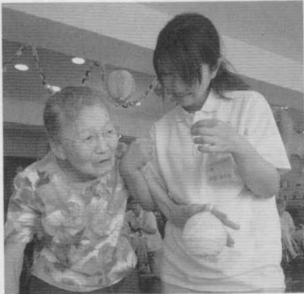
ヨーヨー釣りや輪投げに挑戦!