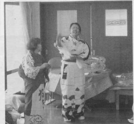
浴衣に着替えて踊りました