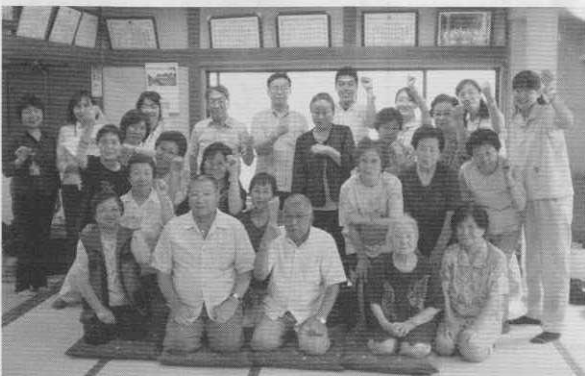
写真は第二回青雲稻荷神社社務所の様子

今後毎月1回程度開催していく予定です。気軽に皆さんでわいわいと話しながら開催していきますので、興味がある方はぜひ南大井・南大井第二在宅介護支援センターまでお問い合わせください。