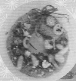
リース・ペーパークラフト等展示しました

1階の作品展示コーナーでは、書道、パッチワーク、花のリース等、ご利用者の力作を展示、大勢の方がお立ち寄り下さいました。 また、広報誌『さくら会だより』による10年史を作成し、今までとは違う角度からさくら会の歴史を振り返りました。 隣のリハビリ室では、日頃行っているリハビリの紹介と分かりやすい説明をさせていただきます。