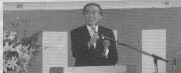
濱野品川区長よりお祝いの言葉を頂戴しました