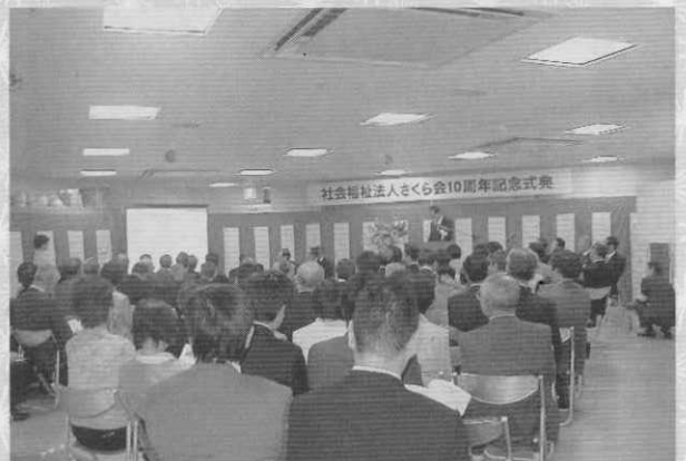
式典の様子。たくさんの方にお越しいただきました