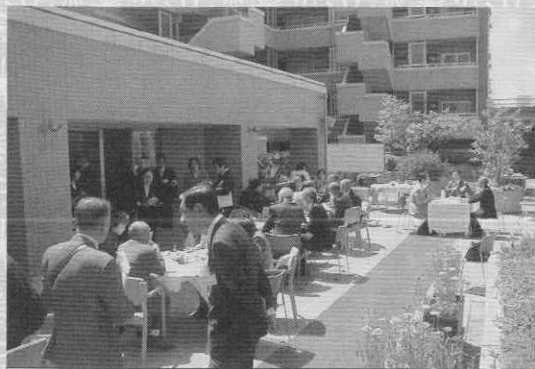
庭園での祝賀会の様子