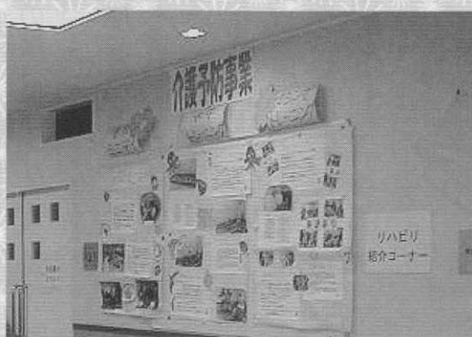
介護予防事業紹介コーナー

1階の作品展示コーナーでは、書道、パッチワーク、花のリース等、ご利用者の力作を展示、大勢の方がお立ち寄り下さいました。 また、広報誌『さくら会だより』による10年史を作成し、今までとは違う角度からさくら会の歴史を振り返りました。 隣のリハビリ室では、日頃行っているリハビリの紹介と分かりやすい説明をさせていただきます。