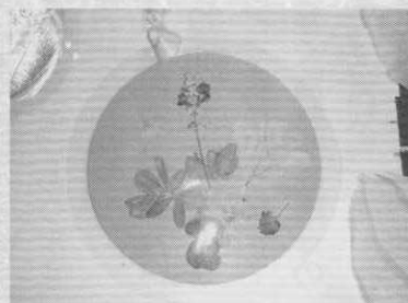
お祝いカード 裏にはお祝いの言葉があります