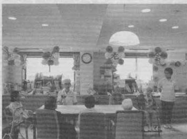
全員で楽しくお祝いをしました

後半は皆さんで歌を歌って、最後のお楽しみは「おやつバイキング」。ケーキやお饅頭、そしておせんべいと人気は手作りあんみつでした。