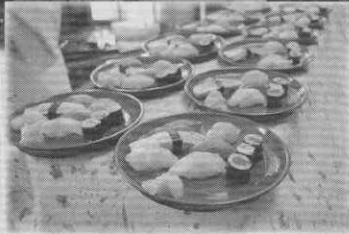
ケアセンター南大井