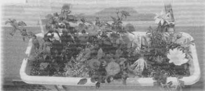
さくらハイツ南大井