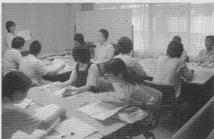
新規採用時の研修