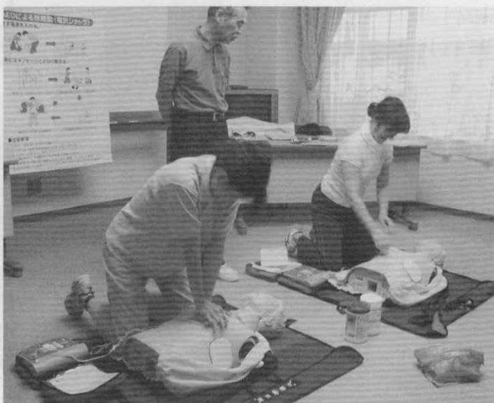
大井消防署によるAEDと普通救命救急の研修