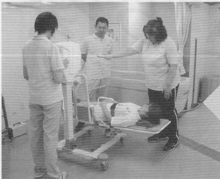
特殊浴槽での入浴介助研修